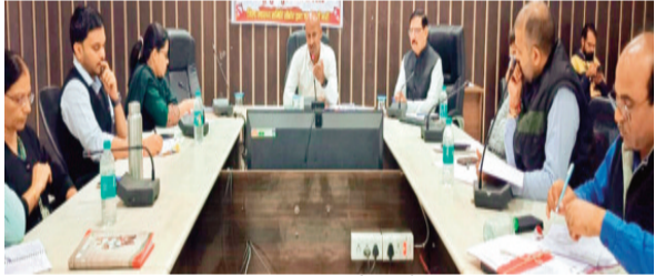
हरिभूमि न्यूज | सीहोर

कलेक्टर बालागुरु के की अध्यक्षता में जिला पंचायत सभाकक्ष में वेक्टर जनित रोगों के प्रभावी नियंत्रण एवं रोकथाम के लिए जिला स्तरीय अन्तर्विभागीय बैठक आयोजित की गई। बैठक में कलेक्टर बालागुरु के, ने डेगू, मलेरिया, चिकनगुनिया जैसे वेक्टर जनित रोगों की स्थिति की समीक्षा करते हुए सभी विभागों को समन्वय के साथ प्रभावी नियंत्रण उपाय लागू करने के निर्देश दिए। उन्होंने कहा कि डेगू नियंत्रण केवल स्वास्थ्य विभाग का नहीं, बल्कि सभी विभागों और समुदाय का संयुक्त दायित्व है। उन्होंने निर्देश दिए कि सभी विभाग समन्वित रूप से कार्य करें, नियमित समीक्षा करें और यह सुनिश्चित करें कि जिले में वेक्टर जनित रोगों पर प्रभावी नियंत्रण एवं रोकथाम हो सके।